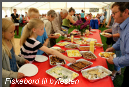
Fiskebord til byfesten