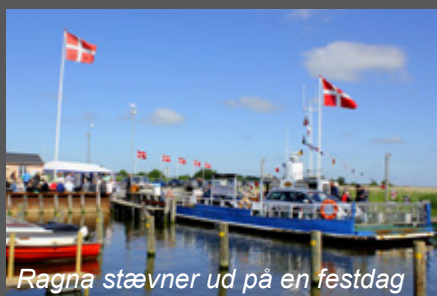
Ragna stævner ud på en festdag