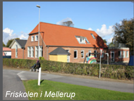
Friskolen i Mellerup

Skolerne skal fortsat have mulighed for at udvikle sig, så de giver liv til landsbyen.