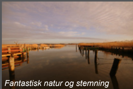
Fantastisk natur og stemning

Mellerup skal være kendt som den attraktive boligby i Naturpark Randers Fjord.