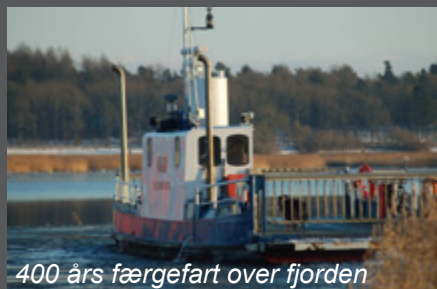
400 års færgefart over fjorden