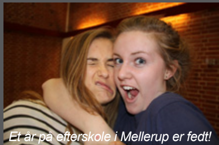
Et år på efterskole i Mellerup er fedt!