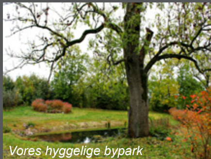
Vores hyggelige bypark